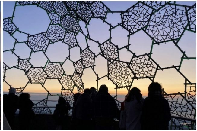
左:六甲ケーブル六甲山上駅「天覧台」、右:「自然体感展望台 六甲枝垂れ」から望む初日の出の様子