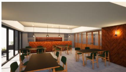
ダイニングラウンジ

※共用部の企画・デザイン監修(一部):成瀬・猪熊建築設計事務所 ※各イメージは現段階での想像図であり、実際とは異なる場合がございます。