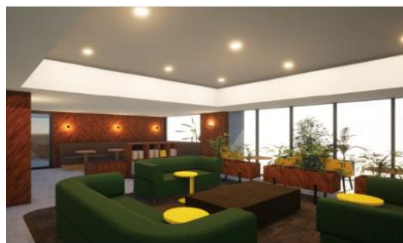
リビングラウンジ