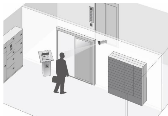
「Tebra FACE pass」イメージ