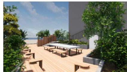
ルーフトップラウンジ

また、ソフト面では、本物件専属のコミュニティマネージャーが、入居者の興味や関心事を採り入れた入居者限定のイベントを開催し、コミュニティの醸成をお手伝いします。