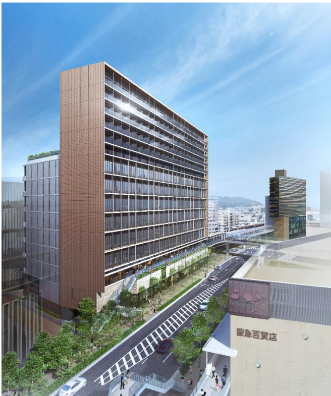
賃貸マンション「ジオエント西宮北口」外観

本物件は、1K・1Rを主体に2LDKまで6つのバリエーションの住居をラインナップした、賃貸マンションです。本物件の最大の魅力は、入居者同士が繋がることによって、互いの成長や学びとなるコミュニティ醸成をするためのさまざまな取組をハード面とソフト面の両面で採用しているところです。