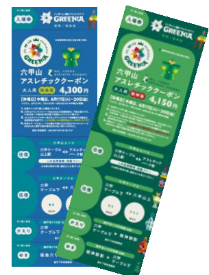
六甲山アスレチッククーポン 券面ビジュアル