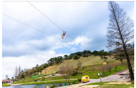
ロングジップスライド