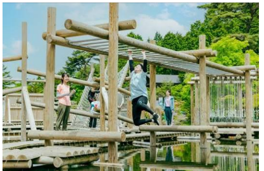
水上アスレチック