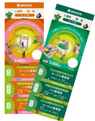
六甲ケーブルアスレチッククーポン 券面ビジュアル