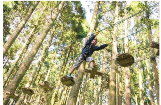
フォレストアドベンチャー

【詳細情報】 https://www.rokkosan.com/greenia/pickup/event/5069/