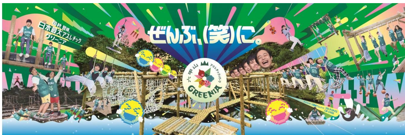
2025シーズン 宣伝用ビジュアル

※5月3日(土・祝)から6日(火・休)の駐車料金は特別料金の2,000円/日です。