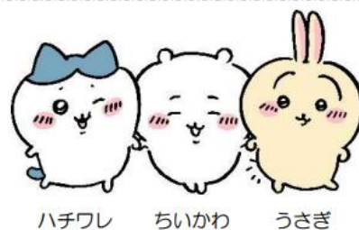
ハチワレ ちいかわ うさぎ

イラストレーターのナガノ氏が描く Twitter 発の漫画。 いつも一生懸命なちいかわと友達のハチワレ、うさぎなどの個性豊かな キャラクターたちが繰り広げる、楽しくて、切なくて、 ちょっとハードな日々の物語。SNS や LINE スタンプでも人気を集め、 2022 年には日本キャラクター大賞グランプリも受賞しています。