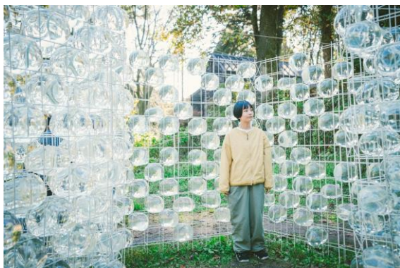
加藤美紗《溢れる》2023 年