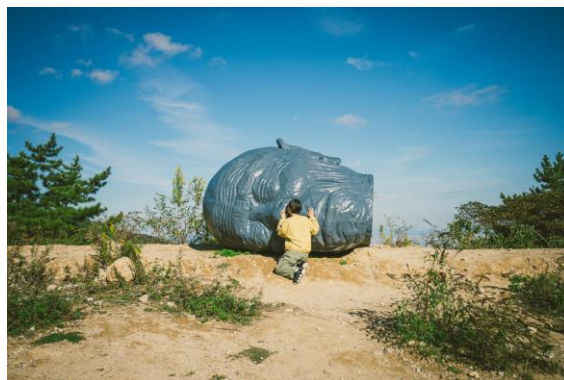
佐藤圭一《じいちゃんの鼻の穴に宇宙があった。》 2023 年