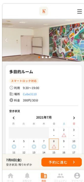
スマートフォン版 施設予約ページ

「彩都スマートシティコンソーシアム」（※1）では、彩都におけるスマートシティの実現に向けて、7月8日、株式会社フォーシーカンパニーが運営する「彩都スタイルクラブ」（※2）の会員向けポータルサイト「彩都NAVI」を、株式会社ビットキーが提供する「homehub」（※3）を利用して刷新しました。