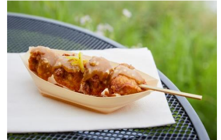
淡路鶏のから揚げ串 六甲味噌の柚子ソースがけ 650円 (提供店舗: 六甲フードテラス)