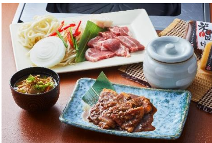
ラム肩肉と六甲味噌漬けラムもも肉 2,400円 (提供店舗: ジンギスカンパレス)