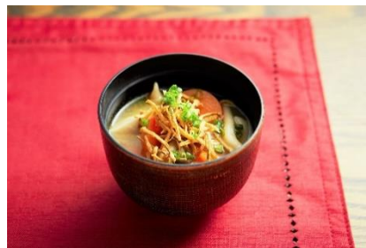
具たくさん六甲味噌のお味噌汁 350円 (提供店舗: ジンギスカンパレス)