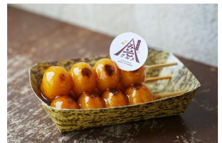
六甲味噌だんご 600円 (提供店舗: 六甲フードテラス)