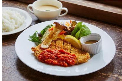
三田ポークカツ 2種の六甲味噌ソース 2,000円 (提供店舗: 六甲ビューパレス)