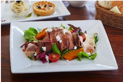
六甲味噌漬けステーキ 秋のサラダ仕立て 2,980円 (提供店舗: グラニットカフェ)

六甲ガーデンテラス内の4つの飲食店舗では、2023年11月23日まで、六甲山麓で育まれた「六甲味噌」(加温せずに熟成させた天然醸造の味噌)を使用した個性的なメニューを提供しています。各店舗には、神戸・大阪の眺望が楽しめる座席を多数ご用意しておりますので、絶景と共に楽しみください。※全て税込価格です。