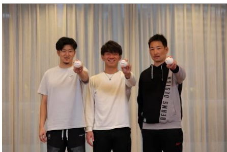
【トラが誇るサウスポーがトリオでテーマトーク！ マウンドではクールなあの左腕が…!?】