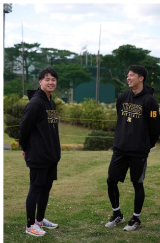
【復活、そして躍進の同学年仲よし右腕対談 僕たちふたりで、アレに貢献します！】