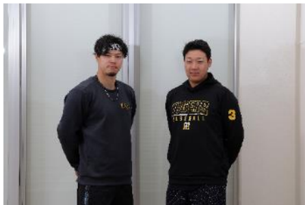
【2023 猛虎打線の核はオレたちだ！】