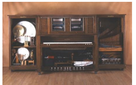
自動演奏ピアノ「ワーリッツァー・スタイル“O” フォトプレーヤー」1920年、アメリカ