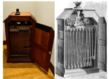
左:キネトスコープ 1891年、アメリカ(2001年復元) 右:キネトスコープ図(1894年)

当施設の自動演奏ピアノ「ワーリッツァー・スタイル“O”フォトプレーヤー」は、ピアノやオルガン、ドラム、シンバルなどの楽器の音を自動演奏するほか、映画の画面に合わせて、手動で鳥の鳴き声やボートの汽笛などの効果音を出すことができます。シアトルで実際に映画の上映時に使用されていたものです。