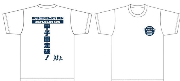
オリジナルTシャツ ¥1,500(税込)