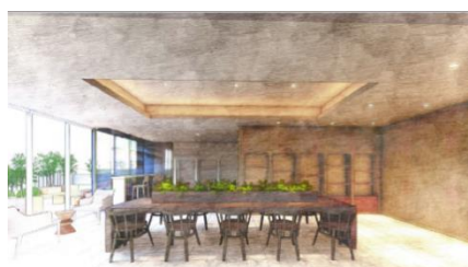
3F住宅共用部ライブラリーラウンジ完成イメージ