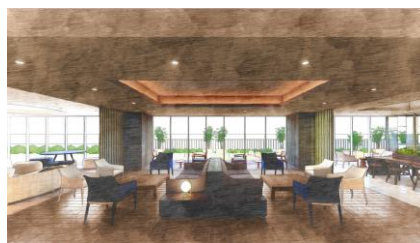
3F住宅共用部ラウンジ完成イメージ