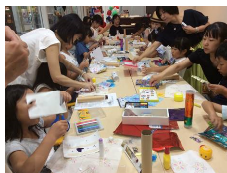
「スタジモにしのみや」で過去に開催されたイベントの様子