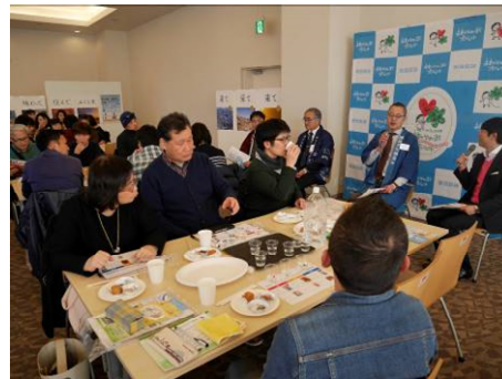
過去に開催した「阪急阪神 ゆめ・まちソーシャルラボ」の様子