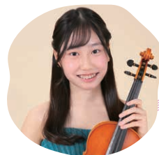
ヴァイオリン 花田 理子 Riko Hanada

2005年に宝塚音楽学校に入学。2007年に宝塚歌劇団第93期生として入団・初舞台。2011年に雪組トップ娘役に就任。2012年に退団後は、映画『マザー』で俳優としての活動をスタート。主な出演作品として、ドラマ『早子先生、結婚するって本当ですか?』『沈まぬ太陽』、映画『大コメ騒動』、声優としてはテレビアニメ『ポケットモンスター』アゲート役(テレビ東系列)、『オー!とんぼ』安谷屋洋子役(テレビ東系列)に出演。舞台では宝塚歌劇雪組pre100th Anniversary『Greatest Dream』ミュージカル『インサイド・ウィリアム』EXPO2025『未来へのOne Step!〜世界を結び愛の歌声〜』などに出演。