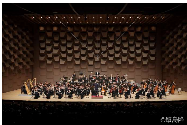
大阪フィルハーモニー交響楽団

阪急電鉄では、阪急阪神ホールディングスグループの社会貢献活動「阪急阪神 未来のゆめ・まちプロジェクト」の一環として、6月22日(日)に「阪急ゆめ・まち 親子チャリティコンサート」を開催します。