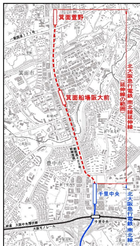
南北線延伸線 路線図