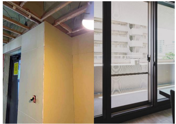
外気に面する壁に施工された断熱材と全窓に設置された内窓

また、省エネ効率の高い水栓、高断熱浴槽、エコシャワー、節水トイレ、LED照明を採用しました。これにより、住宅設備等にかかる一次エネルギー消費量が改修前と比較して約17%削減され、目安光熱費は年間約32,000円の削減が見込まれます※3。