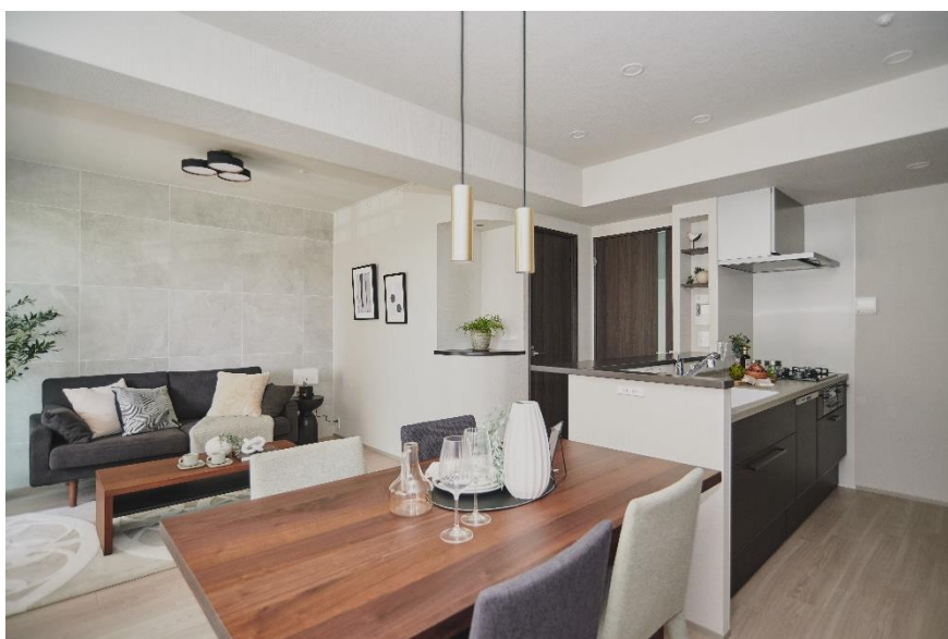
ZEH水準を満たす省エネ改修を行った「ジオ阪急千里山田センターウィング」の一室

阪急阪神不動産株式会社では、一住戸単位での物件取得からリノベーション、施工管理までトータルプロデュースする買取再販事業『Styles』を推進しています。この度、分譲マンション「ジオ阪急千里山田センターウィング」の一室（以下、本物件）において、ZEH水準 ※1 を満たす省エネ改修を行い、8月24日（土）よりリノベーション済住宅として販売を開始しました。