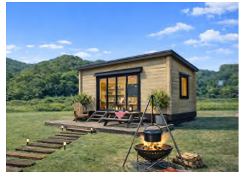
滞在施設のイメージ

所 在 地：大阪府豊能郡豊能町吉川 50 （能勢電鉄妙見口駅徒歩 10 分） 滞 在 施 設：木造丸太組み工法平屋建 2 棟（約 12 m 2 ） 木造在来工法平屋建 1 棟（約 19 m 2 ） 設 備：（滞在施設）AC 電源、エアコン （共 用 棟）トイレ、シャワー、洗い場、 コミュニティスペース、受付