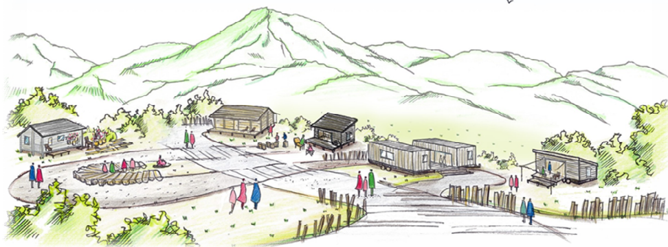
「TUMUGI BASE-ツムギバ-」のロゴマークと完成イメージ