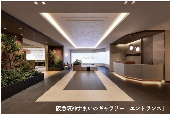
阪急阪神すまいのギャラリー「エントランス」

新築分譲マンション〈ジオ〉や中古物件売買の相談、リフォーム等のご提案が1つの拠点で可能です!