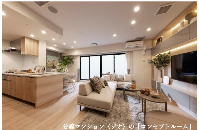
分譲マンション〈ジオ〉の「コンセプトルーム」

阪急阪神不動産株式会社は、先日開業した「阪急西宮ガーデンズ プラス館」の9階部分に、住宅に関する相談が何でもできるワンストップサービス拠点として「阪急阪神すまいのギャラリー」を2023年11月3日(金・祝)にグランドオープンします。