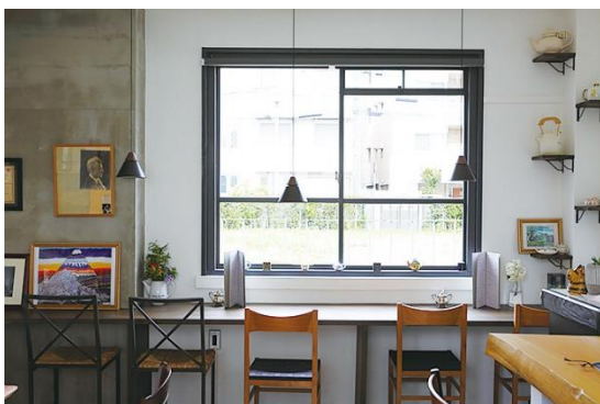
<Tea Saloon MUSICA>