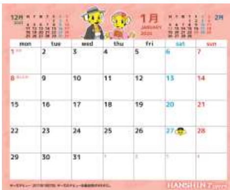
◆阪神タイガース マスコットカレンダー 2024 卓上タイプ：表紙・1月表面