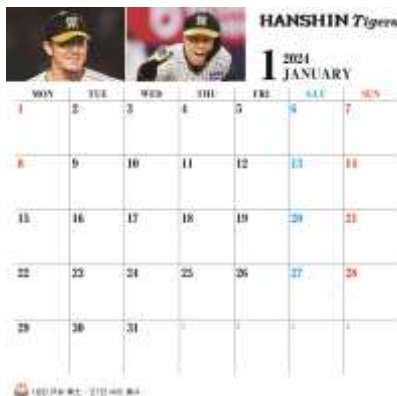
◆阪神タイガース デスクカレンダー 2024 卓上タイプ：表紙・1月表面