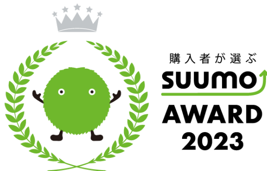
SUUMO AWARD 2023 関西 分譲マンションデベロッパー・販売会社の部 接客満足度部門 優秀賞