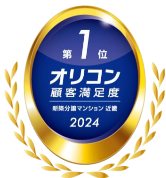
2024 年 オリコン顧客満足度®調査 新築分譲マンション 近畿 第 1 位

また、株式会社リクルートが実施した新築マンション購入者が選んだ顧客満足度ランキング「SUUMO AWARD（2023 年関西版）」では、接客満足度部門をはじめ 11 部門で優秀賞を受賞するなど、多くのお客様にご評価いただいています。