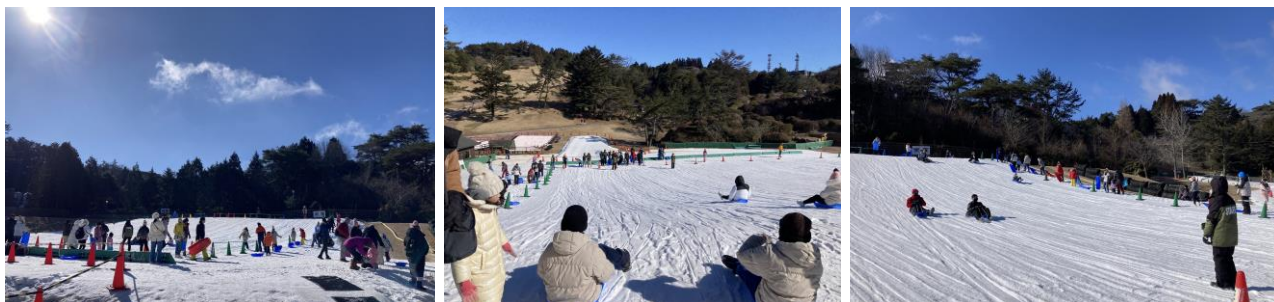
外国人団体 雪ゾリ・雪あそびゲレンデ「スノーランド」利用時の様子(2023年度)

春節シーズンが本格化する2月10日(土)～17日(土)の8日間には、69件、約1,950名*が来園する予定です。*1月20日(土)時点の予約ベースの人数。