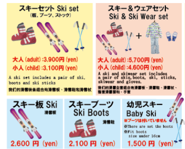
料金案内 POP(英語・中国語表記)

礼拝所設置に伴い、訪日ムスリム旅行団体、個人旅行者の方向けに、「ハラールフード」メニューを販売しております。今後も、国内外からのお客様のニーズに合わせた施設の整備、サービスの拡充に努めて参ります。