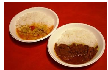
「ハラールフード」メニュー