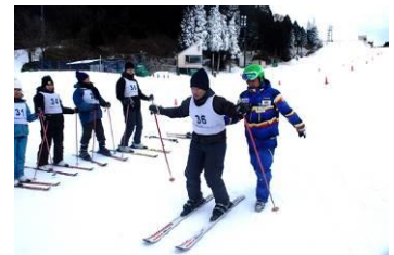
外国人向けスキースクールの様子