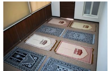
イスラム教徒向け礼拝所 内観