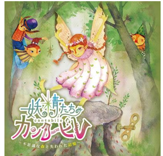
リアル謎解きゲーム『妖精たちのカンタービレ』メインビジュアル

【備考】 ・受付にてリアル謎解きゲーム参加の旨をお申し出ください。 ・本編参加には別途 ROKKO 森の音ミュージアムの入場料、ボーナスステージ参加には別途六甲高山植物園の入園料が必要です。ボーナスステージも参加される場合は、2施設共通券大人1,900円、小人950円のご利用がお薦めです。