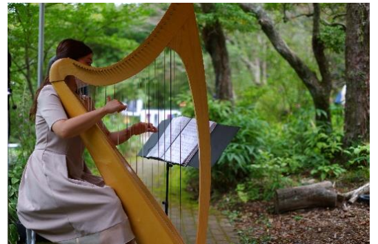
過去の SIKI ガーデンコンサート開催の様子