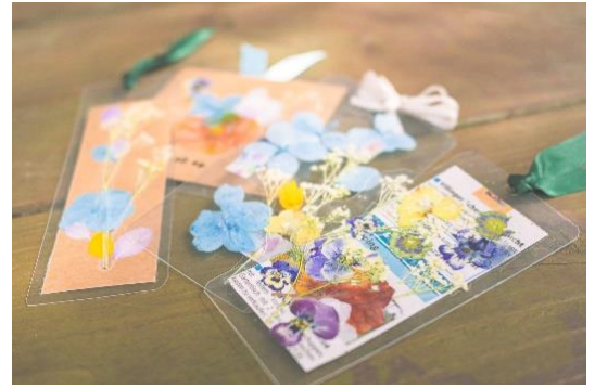
ガーデンワークショップ「押し花ブックマーカー」(イメージ)