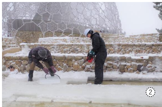
毎年大寒に行われる「氷の切り出し」の様子