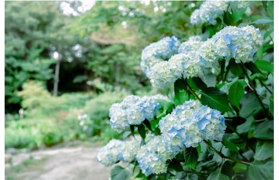
盛夏のSIKIガーデンアジサイの群生