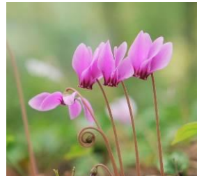
シクラメン・ヘデリフォリウム (11月上旬まで)