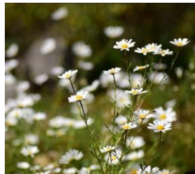
イワギク (10月下旬まで)