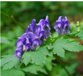
ヤマトリカブト (10月下旬まで)