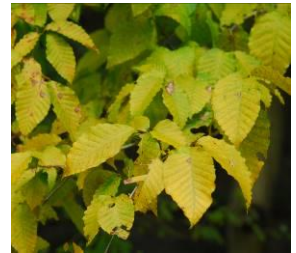
イヌブナ (11月上旬まで)