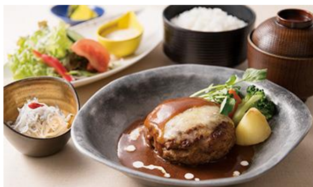
デミグラスチーズハンバーグ膳 1,375円