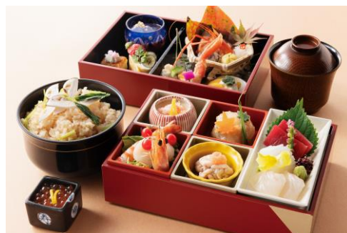
食事付きプランの二段重「花鏡御膳」（通常 2,640 円）