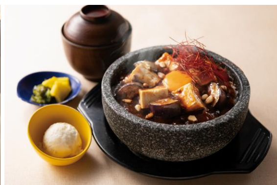
石焼麻辣豆腐丼 1,210円