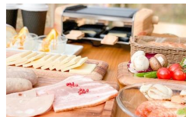
ラクレットチーズグリルセット(イメージ)