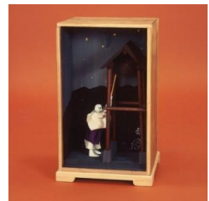
元禄鐘打ち人形 江戸時代末期(1997年複製)