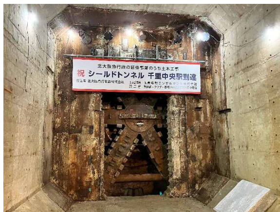
千里中央駅北端部に到達したシールドマシン

【リリース配付先】豊中記者クラブ、青灯クラブ、近畿電鉄記者クラブ、北摂記者クラブ ほか