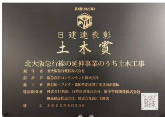
日建連表彰 2023「土木賞」受賞記念品

2024年3月23日（土）の南北線延伸線の開業に向けて引き続き安全第一で準備を進めて参ります。