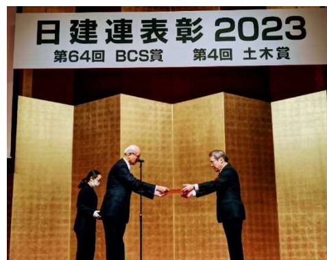
日本建設業連合会 宮本洋一会長より表彰を受けました