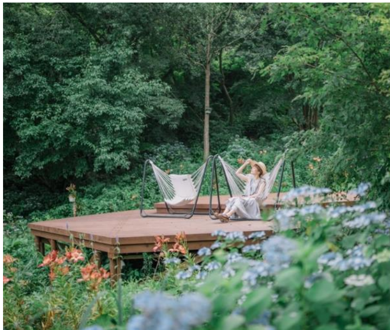
「SIKIガーデン～音の散策路～」のアジサイとチェアモック

六甲山観光株式会社(本社:神戸市灘区 社長:寺西公彦)が運営する、ROKKO森の音ミュージアムでは、2024年7月1日(月)～8月23日(金)に「30th Anniversary 避暑地でひんやり 森の音サマーフェア」を開催します。