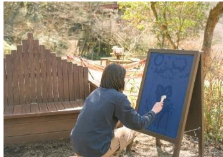
音のベンチ『音楽×ウォーターペイント』(イメージ)