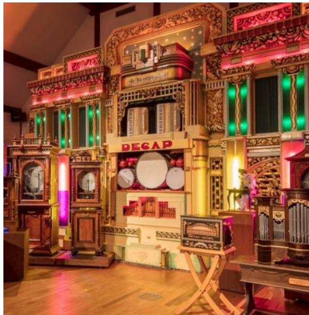
自動演奏オルガンやオルゴールなどの所蔵品