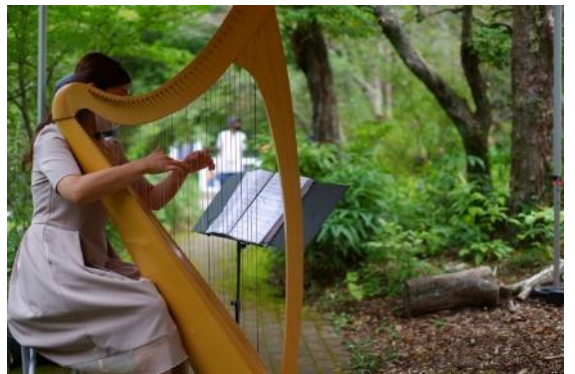
過去の SIKI ガーデンコンサートの様子