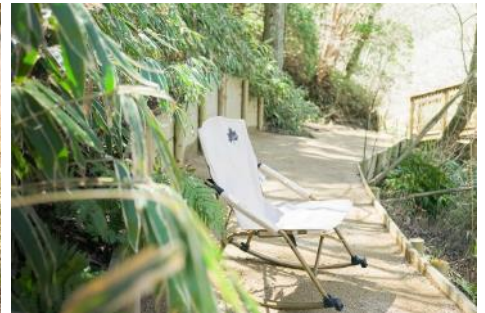
SIKI ガーデンチェアリング(イメージ)