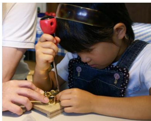
オルゴール組立体験の様子(イメージ)