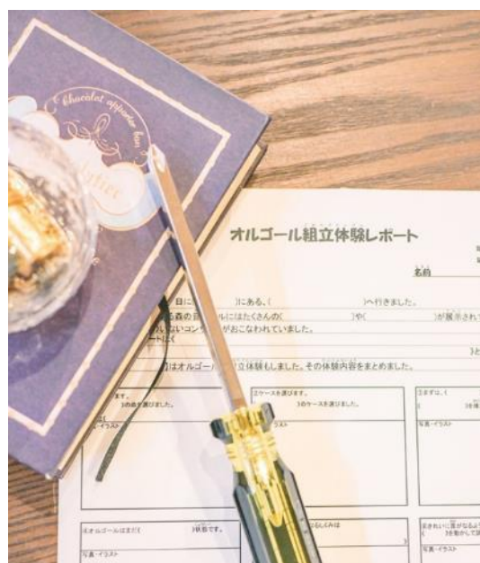
オルゴール組立体験レポート(イメージ)