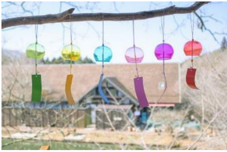
ツリーハウスのひんやりフォトスポット(イメージ)