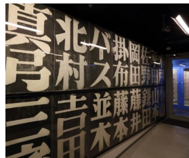
<手書き時代の選手名板>