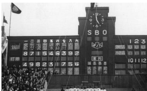
所蔵：阪神電気鉄道株式会社 <手書き時代のスコアボード>

『甲子園フォント』の完成をご期待ください。『甲子園フォント』制作プロジェクトの概要は次ページのとおりです。