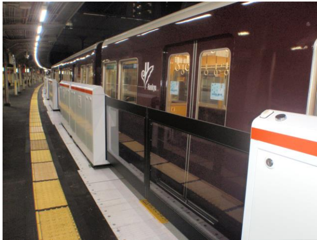
可動式ホーム柵(十三駅3号線)