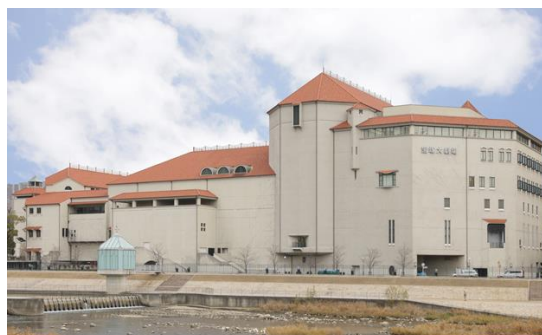
宝塚大劇場の外観

阪急電鉄（代表取締役社長：杉山 健博）と大阪ガス（代表取締役社長：本荘 武宏）は、政府が運用する温室効果ガス排出削減の認証制度「J-クレジット制度」 (※1) を活用した「宝塚大劇場カーボン・オフセット公演」を開催し、当該公演期間中に排出されるすべてのCO 2 をオフセットします。2014年から始めた両社によるこの取組は今回で6回目となります。