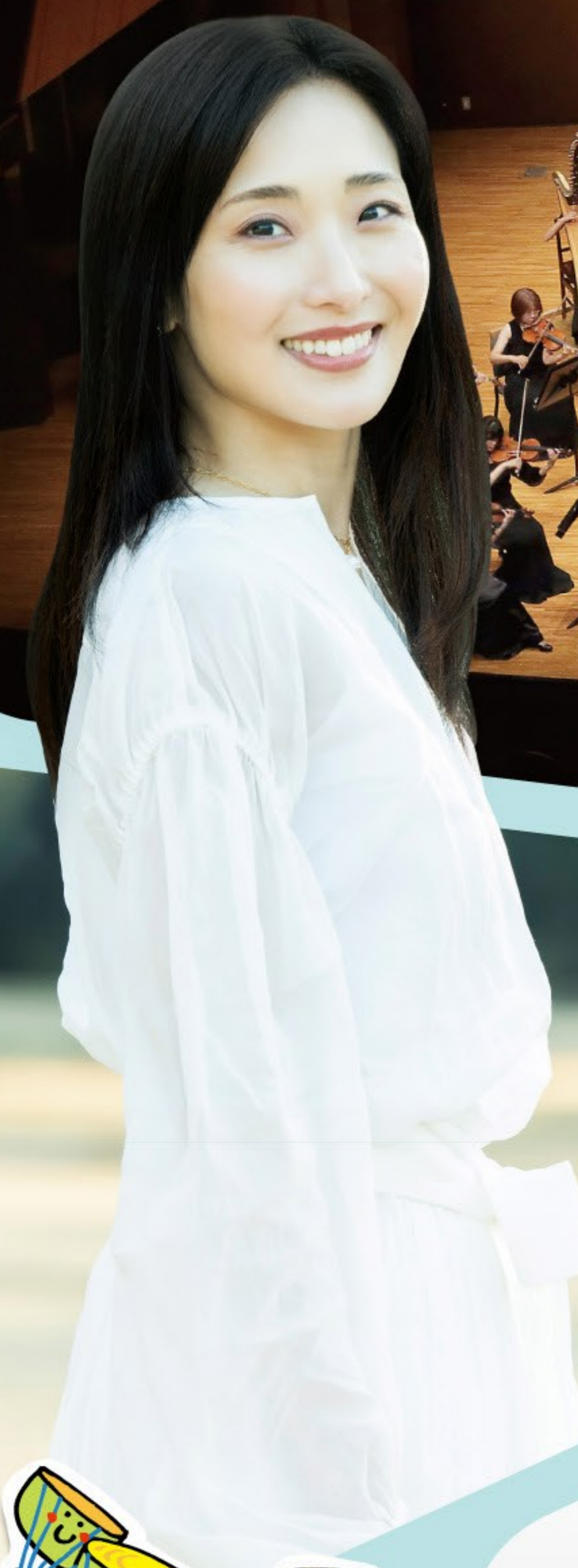
〈ナビゲート〉 らんの 蘭乃 はな (女優)